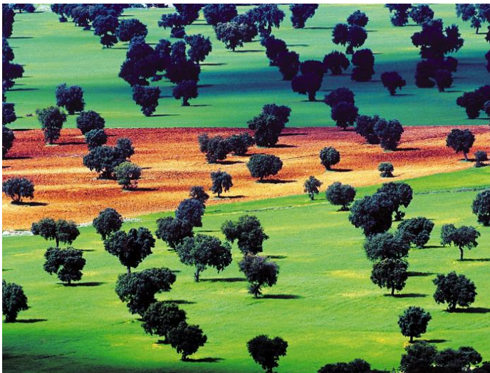
"Equilibrio". Jorge Sierra