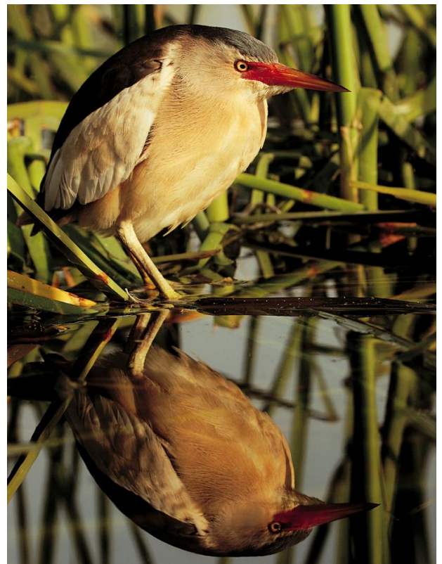
"Reflejo oculto. Avetorillo común". Javier Ramos Pérez