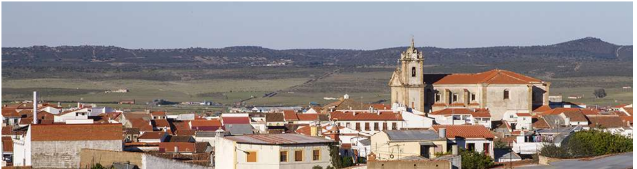
1. San Vicente de Alcántara. Iglesia de S. Vicente Mártir. Zona de cazadero con pastizal y Sierra de San Pedro al fondo.