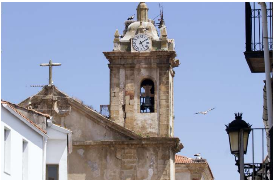
3. El módulo de liberación apenas causa impacto visual en el edificio.