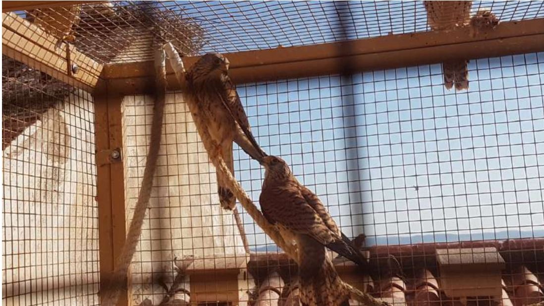
4. Dos adultos permanecerán en el interior del módulo hasta que los pollos decidan emigrar.