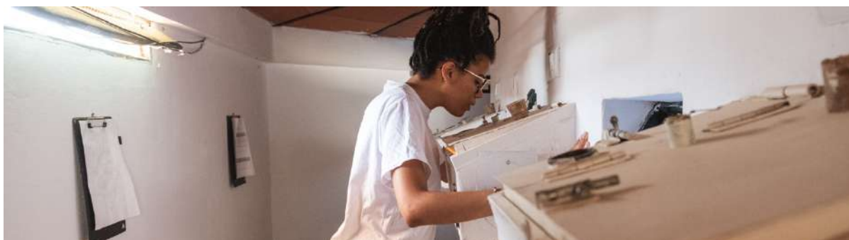
10. Seguimiento diario de la cría, de febrero a mayo.