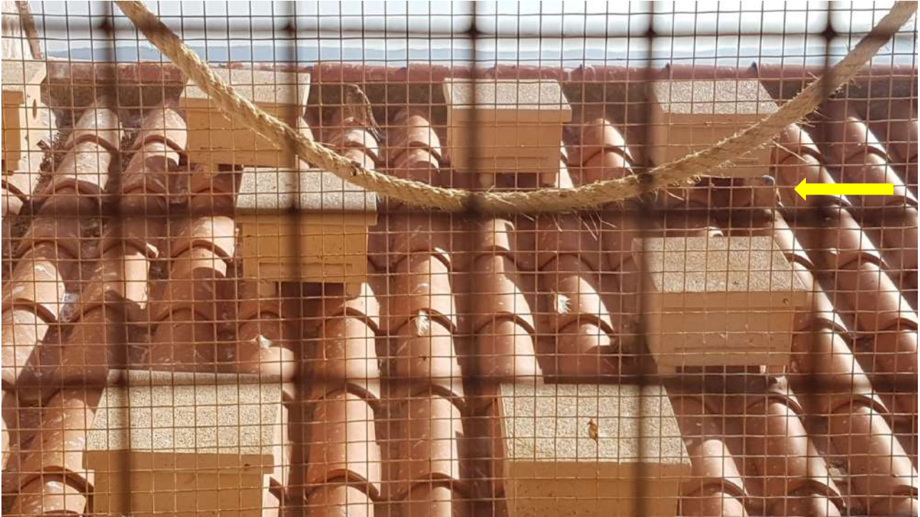
6. Macho joven de la población salvaje, sin anillas, junto a un pollo del proyecto.