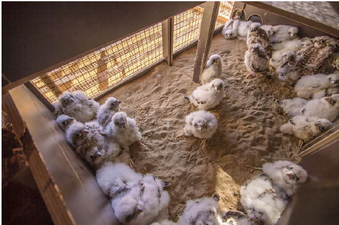
5. Caja de liberación el día que se introdujeron los pollos.