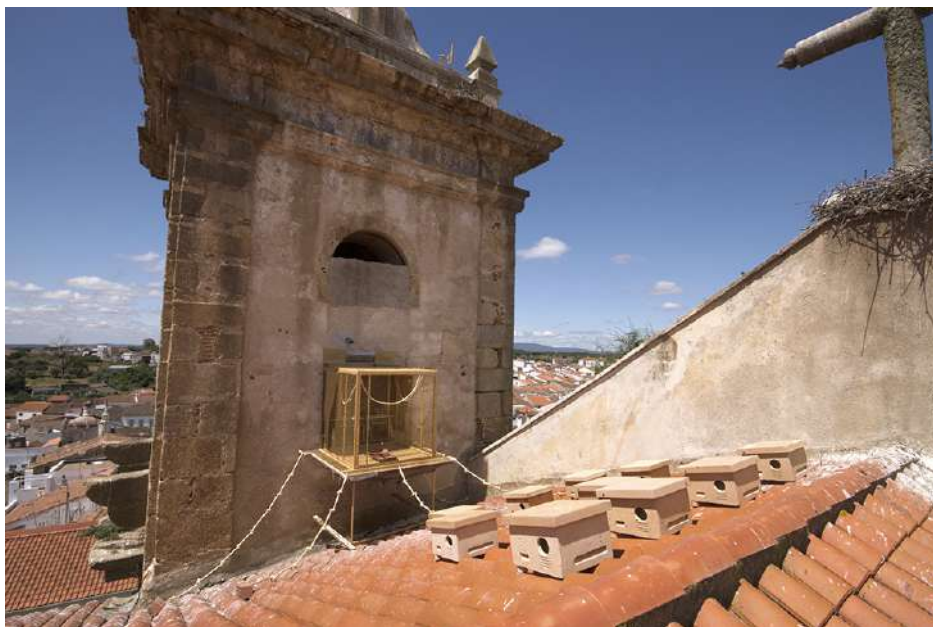
2. Módulo de liberación y nidadales en la zona exterior.