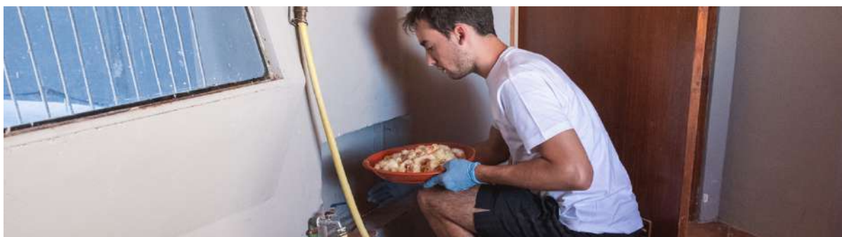
9. Mantenimiento del stock reproductor en el Centro de Cría de Cernícalo Primilla de DEMA