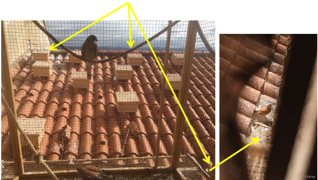
7. Parejas reproductoras de la nueva colonia de cernícalo primilla.