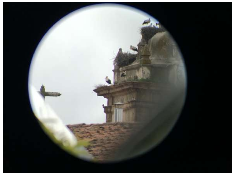
12. Censo desde puntos lejanos que permitan tener una visión amplia de la cubierta.