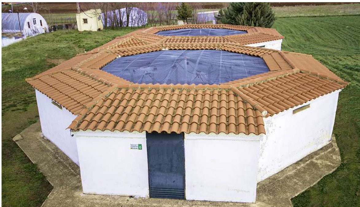
8. Exterior del Centro de Cría de Cernícalo Primilla de DEMA Núcleos de cría colectiva.