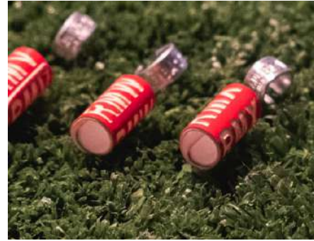
11. Chequeo veterinario e identificación individual de 50 pollos.