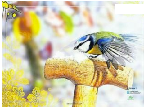
O Grove presume de pájaros, y además los enseña