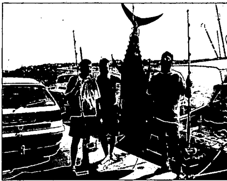
Darrerament s'han multiplicat els aficionats a la pesca recreativa.