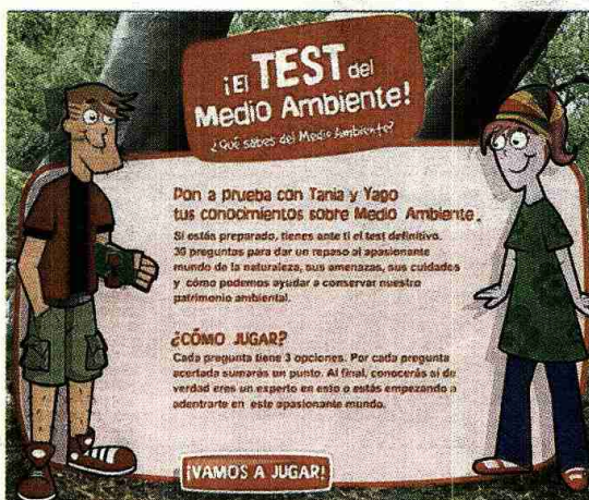
Los adolescentes pueden comprobar sus conocimientos en el «Test del medio ambiente» con la ayuda de Yago y Tania

Se han creado dos nuevos personajes. Se trata de dos especies que están en peligro en nuestro país: el sapillo balear «Tomeu» y la loba «Lola»