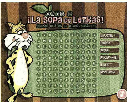
«Mayú», una atractiva hembra de lince, ayuda a terminar con éxito una sopa de letras muy biológica

de seleccionar dos niveles, de 12 y 20 piezas, hacer clic sobre cada una de ellas y arrastrarlas donde crean que pueden encajar hasta formar una imagen que contiene un personaje de BioDíver. Finalmente, en el juego «Descubre al personaje» se trata de adivinar a qué especie amenazada corresponde la silueta que poco a poco se va dibujando al hacer clic en la lupa de «Robin».