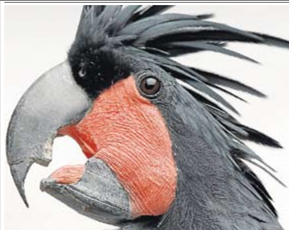
Cacatúa de las palmas ('Probosciger aterrimus'). JOEL SARTORE