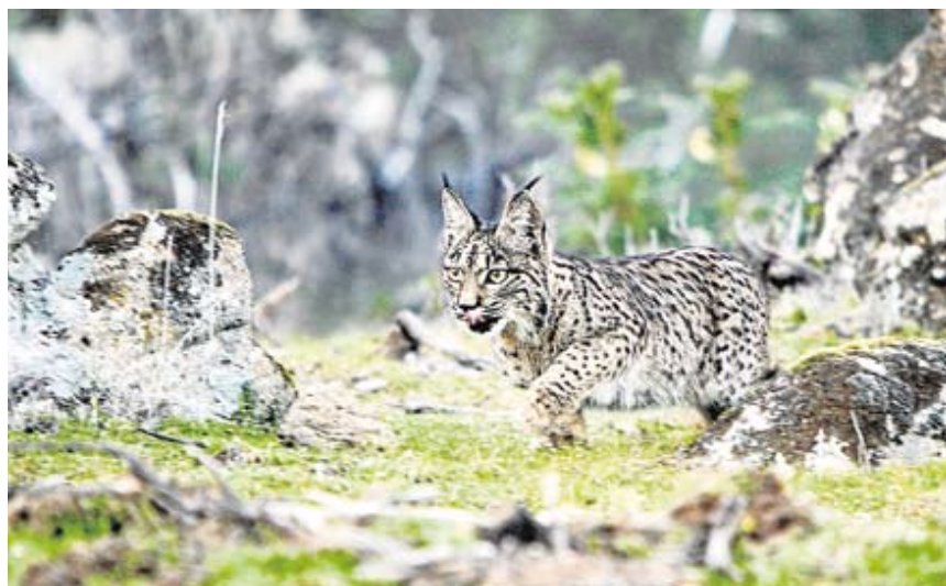
Lince ibérico ('Lynx pardinus'). ANDONI CANELA

Dos fotógrafos muestran su trabajo para advertir que la biodiversidad está en peligro