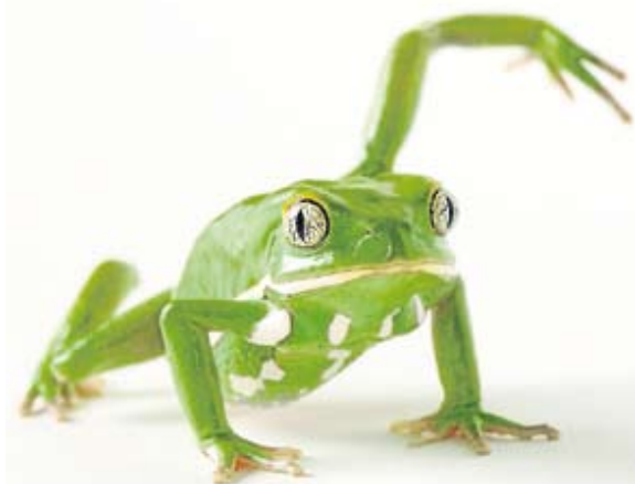
Rana mono encerada ('Phyllomedusa sauvagii').