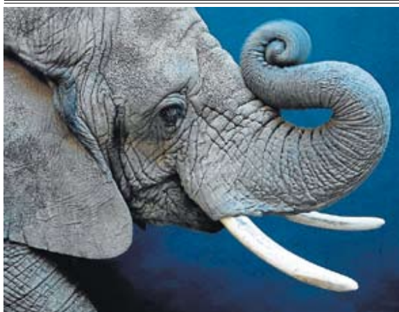
Elefante africano ('Loxodonta africana'). JOEL SARTORE

En el evento, presidido por la ministra de Medio Ambiente Elena Espinosa, ambos repasaron las mejores fotos de su carrera, con un objetivo claro: concienciar del riesgo a que está sometido el planeta. *