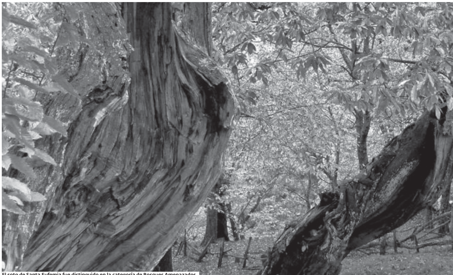
El soto de Santa Eufemia fue distinguido en la categoría de Bosques Amenazados.

ÁRBOL DEL AÑO ▶ O Avó de Chavín, el gran eucalipto que ha echado raíces en Viveiro, fue distinguido ayer como Árbol Gigante del Año en España, mientras que el soto de Santa Eufemia de O Courel, se ha hecho con igual distinción en la categoría de Bosque Amenazado.