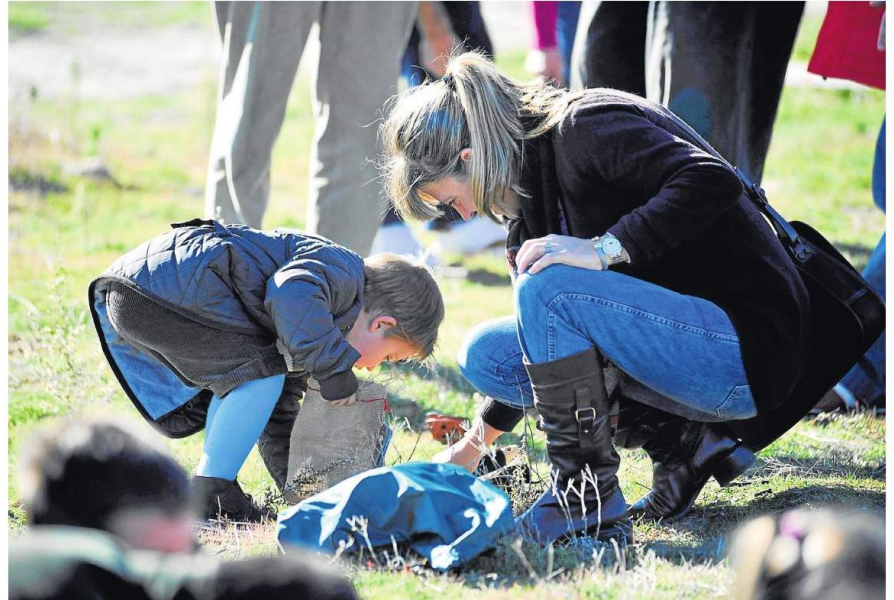
Mayores y pequeños compartieron la plantación en fincas municipales de Culleredo y Lugo

Toyota España busca la movilización y concienciación social para contribuir a la reducción de la presencia de CO2 en la atmósfera. El Día de la Reforestación Toyota 2010 se ha hecho realidad gracias al apoyo de los concesionarios de Toyota España que, como Breogán Motor, han contribuido a esta movilización didáctica que contribuye a la mejora y conservación del patrimonio natural.