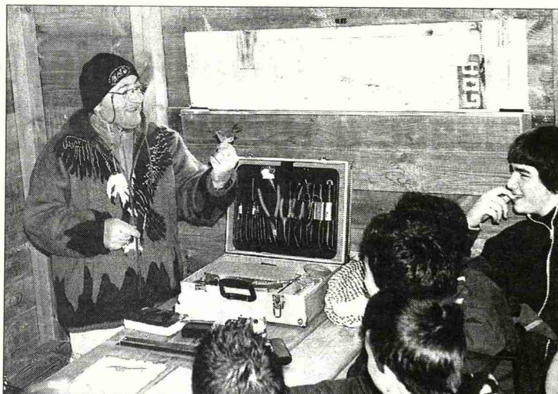
Los jóvenes participaron activamente durante el día dedicado a los humedales