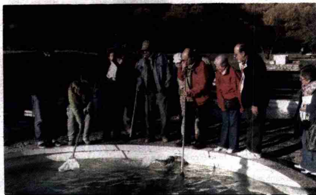
La primera edición de los cursos de formación se cerró con una jornada en la piscifactoría de Uña, que se recoge en la imagen superior.

El proyecto, enmarcado en este programa, se denomina "Fomento del empleo ligado al aprovechamiento sostenible de los recursos ambientales en las zonas rurales de Castilla-La Mancha" y tiene como objetivo mejorar la formación de los trabajadores, potenciar nuevas iniciativas y asesorar en la creación de empresas ligadas al medio natural. De esta forma, a través del fomento de la utilización racional y sostenible de los recursos naturales, colaboramos en la mejora de la calidad del empleo, en la cualificación de los trabajadores de las zonas rurales y en la preservación y mejora del Medio Ambiente de Castilla-La Mancha.