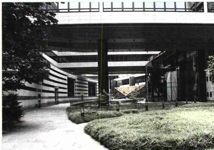
Los edificios eficientes energéticamente consumen menos energía y son más sostenibles.

Esta cita es una iniciativa internacional para promover prácticas sostenibles en la organización de eventos. La Fundación Biodiversidad acogió en su sede la última edición que agrupó a profesionales de España y Portugal. Es una nueva vía para la conciencia ambiental en el turismo congresual.