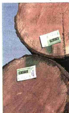
Troncos con certificado forestal.

Emprende Verde.com ha llegado ya a los 1.090 miembros en sus pocos meses de vida. Se han creado 48 grupos de trabajo, siendo los más activos los de cooperación y energías renovables. Aún hay tiempo para participar en el concurso emprende Verde, dotado con 100.000 euros en especie y 50.000 en metálico. Los nuevos emprendedores podrán presentar sus propuestas en la web hasta el 31 de agosto.