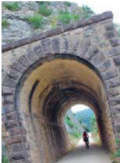
Álava, vía verde vasconavarra.