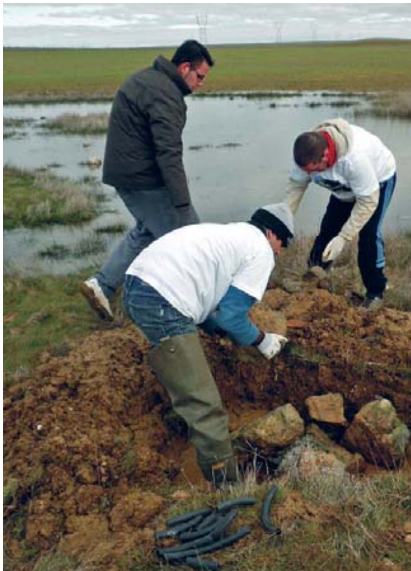
Voluntarios del CEHUM construyen refugios anfibios en la laguna de la Nava (Palencia).

En lo referente a las energías renovables, el documento señala que hay una