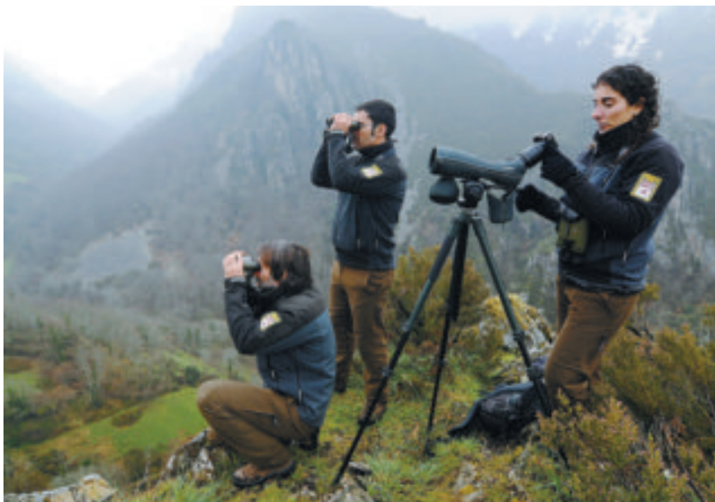
Una patrulla de guardias de la FOP intentando grabar a osos a distancia, sin interferir en su actividad. FOP