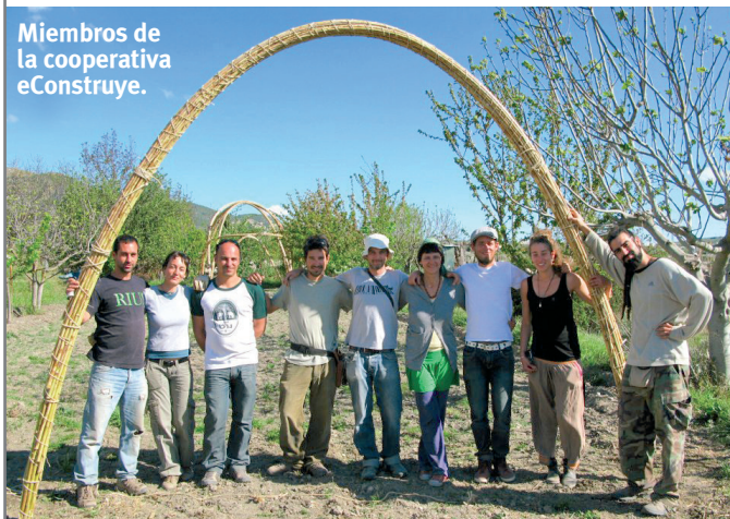
Miembros de la cooperativa eConstruye.