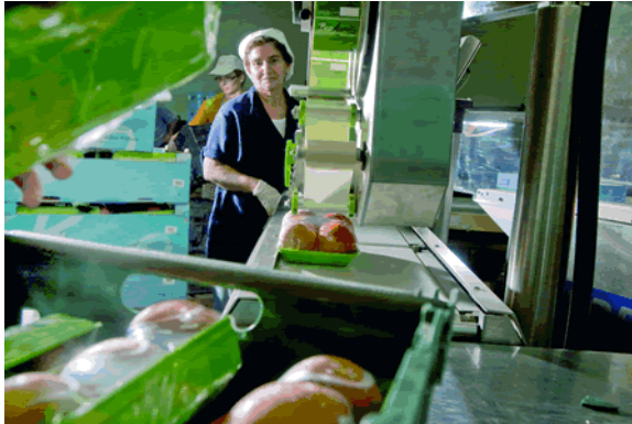
Imagen SEAE, entidad beneficiaria Programa Empleaverde

El Programa empleaverde, gestionado por la Fundación Biodiversidad y cofinanciado por el Fondo Social Europeo, ha abierto una nueva línea de acción en su convocatoria correspondiente a 2012 para proyectos que tengan como destinatarios a emprendedores del sector ambiental. Los beneficiarios de esta línea II podrán ser entidades públicas o privadas, con o sin ánimo de lucro, con sede en España, cuyos proyectos estén dirigidos a realizar acciones de formación y apoyo al emprendimiento verde, tales como cursos, plataformas de e-learning, jornadas, seminarios, congresos, premios y concursos, campañas de sensibilización, material informativo o asesoramiento personalizado, entre otras de este tipo.