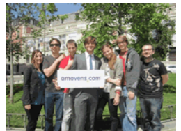
Equipo de Amovens

"Ahorra dinero y emisiones" reza el lema de Amovens, una empresa de "carpooling" dedicada a facilitar el uso del coche compartido entre conductores, una práctica que tiene beneficios tanto para los "carpoolers" como para la sociedad en general.