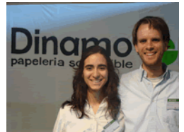
Gerentes Dinamo Papelería Sostenible

Dinamo Papelería Sostenible, la filosofía verde llevada al papel