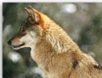
Detalle de la fotografía...