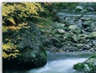
Detalle de la fotografía...