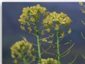
Detalle de la fotografía...

El departamento de Formación de la Fundación Biodiversidad trabaja en la consecución de los siguientes objetivos: