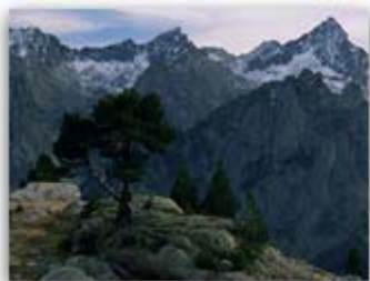
Detalle de la fotografía...

El preservar la biodiversidad en nuestro planeta es un reto que entre todos tenemos que afrontar. Esta preocupación no es nueva. Ya en 1992 en el transcurso de la Conferencia de las Naciones Unidas sobre Medio Ambiente y Desarrollo celebrada en Río de Janeiro, la Comunidad Europea y todos sus Estados miembros firmaron el Convenio sobre Diversidad Biológica.