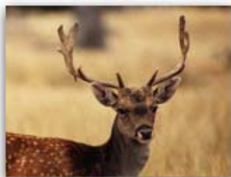
Detalle de la fotografía...

El Departamento de Comunicación y Sensibilización se dedica a la difusión de las actividades que realiza la Fundación Biodiversidad, así como a la organización de actos y campañas de sensibilización de la sociedad en materia ambiental, además de ser responsable de la identidad corporativa y la imagen de la Fundación Biodiversidad.