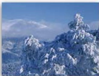
Detalle de la fotografía...

El artículo 1º de los Estatutos de la Fundación Biodiversidad especifica claramente la proyección internacional de la misma, indicando: "Los objetivos de la FB serán desarrollados tanto a nivel nacional como internacional". El Departamento de Internacional se ocupa tanto de los temas de Cooperación como de los fondos europeos que gestiona la Fundación.