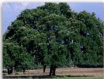
Detalle de la fotografía...

El Departamento de Estudios y Proyectos se encarga de la coordinación y puesta en marcha de Convenios y Convocatorias de Ayudas para el desarrollo de proyectos y estudios relacionados con la temática ambiental. Constituye, por tanto, el enlace entre la FB y otras entidades, con el objetivo de sumar voluntades y apoyar iniciativas en común.