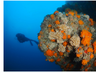
Más de 300 proyectos contribuyen a alcanzar los objetivos del LIFE INTEMARES