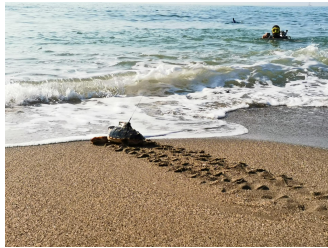
2021, un año de importantes avances