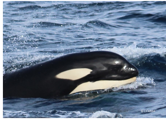
Ponemos en marcha un estudio sobre la interacción de orcas con embarcaciones