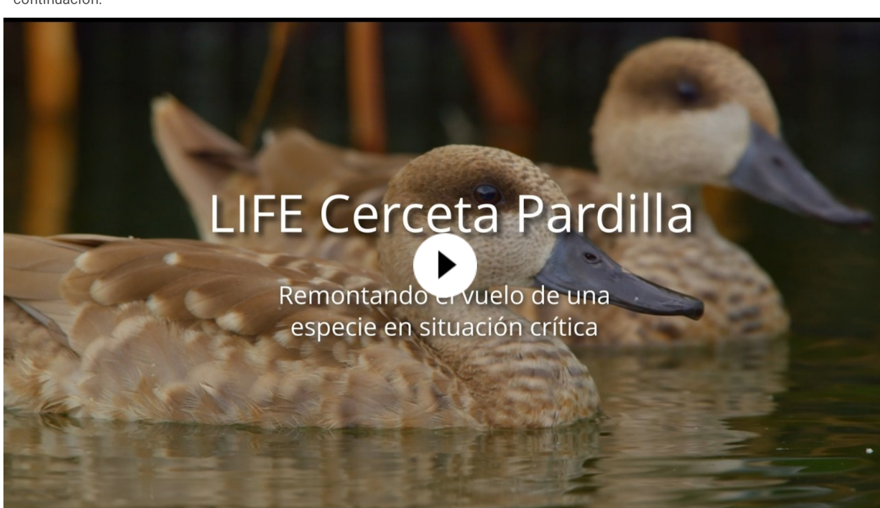
Vídeo de resultados del LIFE Cerceta Pardilla

Estos resultados se muestran en un vídeo , en la web del proyecto y en el informe divulgativo Layman , que se incluyen a continuación: