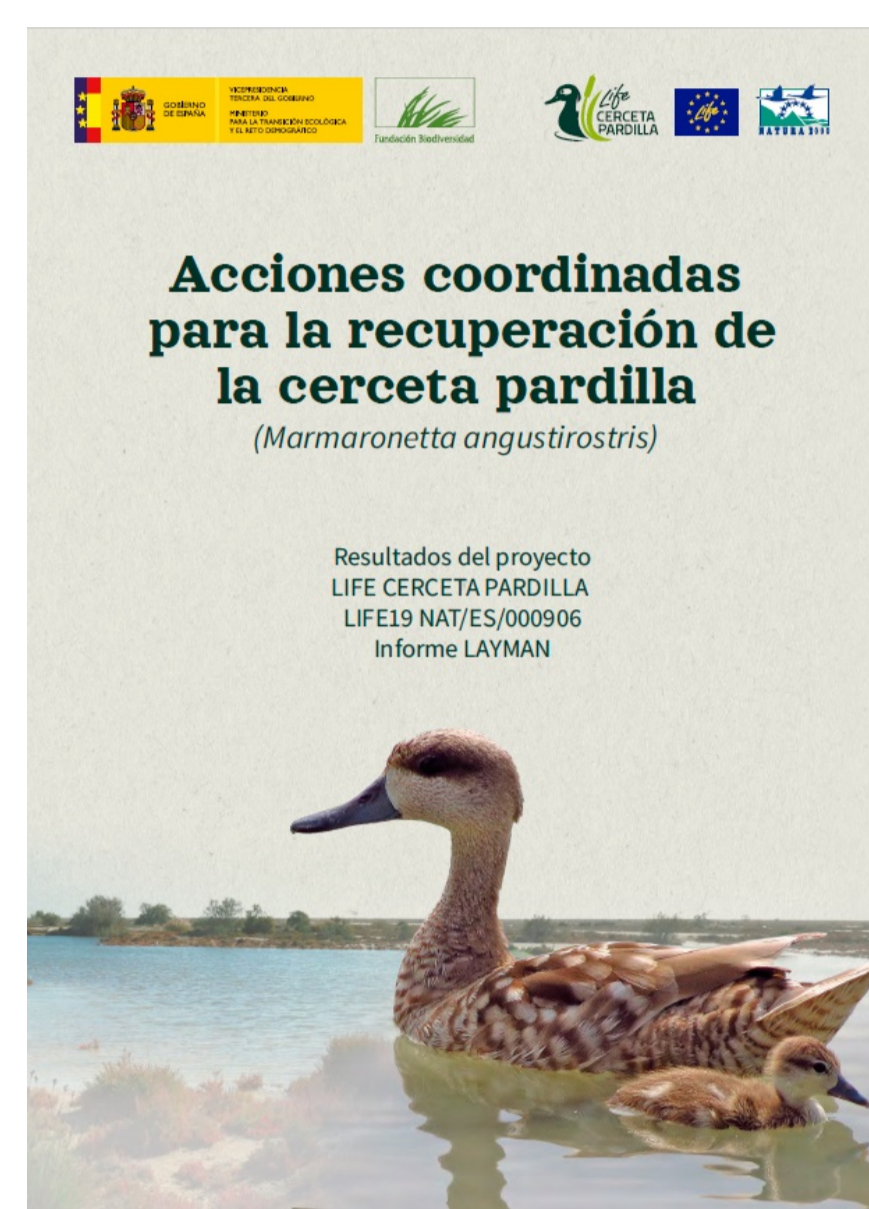
Informe divulgativo Layman